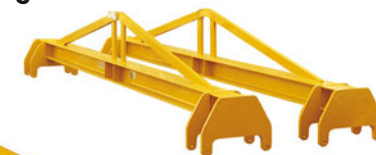
Bilancini con tiranti a otto attacchi fissi