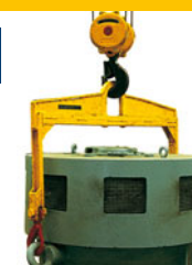
Bilancino con montanti rigidi