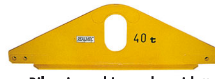
Bilancino ad ingombro ridotto per portate elevate