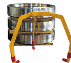
"Ragno" a tre bracci per volani