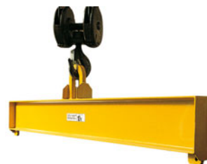
Bilancino a due attacchi fissi